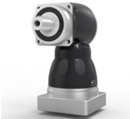
KF S1 / S2